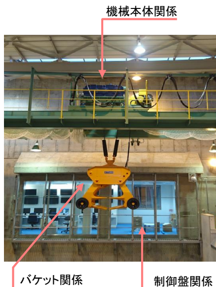
表. 環境クレーン調達推奨部品納期一覧(2022年5月現在)

クレーン関連部品についても部材不足による納期遅延が避けられず、“突然の動かない”に迅速に対応できない可能性が考えられます。