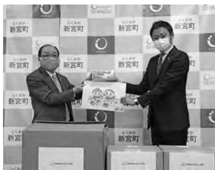
◆株式会社ホンダカーズ博多さま マスク、お絵かき帳