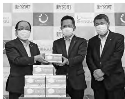
◆東洋ホイスト株式会社さま マスク