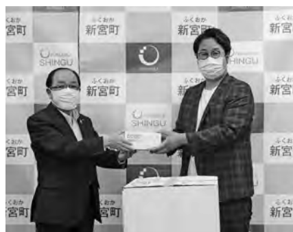
◆みつとも鍼灸整骨院・整体院さま マスク